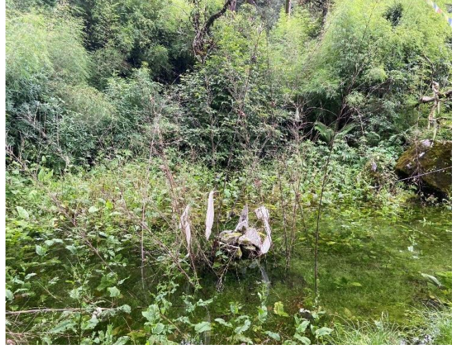
आकृति 1 आमाछोदिङमो गाउँपालिकामा रहेको गोप्पो कुण्ड

आमाछोदिङमो गाउँपालिका पानीको स्रोतले भरिपूर्ण छ । गाउँपालिका भित्र प्राकृतिक रूपमा नै निस्किएका पानीका स्रोतहरू धेरै छन् । पार्वतीकुण्ड, गोप्पो कुण्ड, जागेश्वर कुण्ड, न्होजे कुण्ड, लोडेचे कुण्ड, डिल्पु कुण्ड, त्रिशुली नदी, चिलिमे खोला, दलाड खोलाहरू यस गाउँपालिकाका मुख्य जलस्रोतका आधारहरू हुन् ।